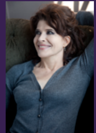
Fanny Ardant