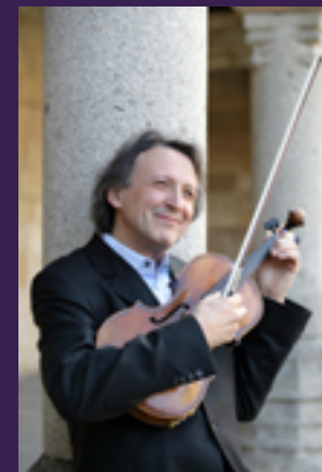
Gérard Caussé

La transposition des suites de Bach à l'alto, instrument dont jouait le Cantor de Leipzig et dont les cordes sont identiques au violoncelle, était pour Gérard Caussé un projet auquel il était attaché depuis l'enfance. La création de ce spectacle tenait donc de la nécessité de l'évidence, pour un artiste convaincu de la richesse naturelle de cette transcription.